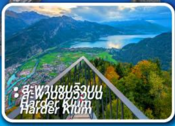
• สะพานชมริบเบิน Harder Klamm