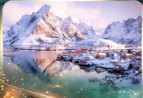
หมู่บ้านเรเนน