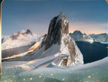
เกาะเซนญา