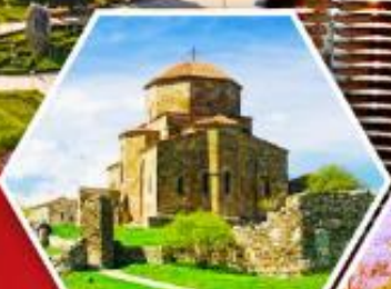
วิหารกอรี