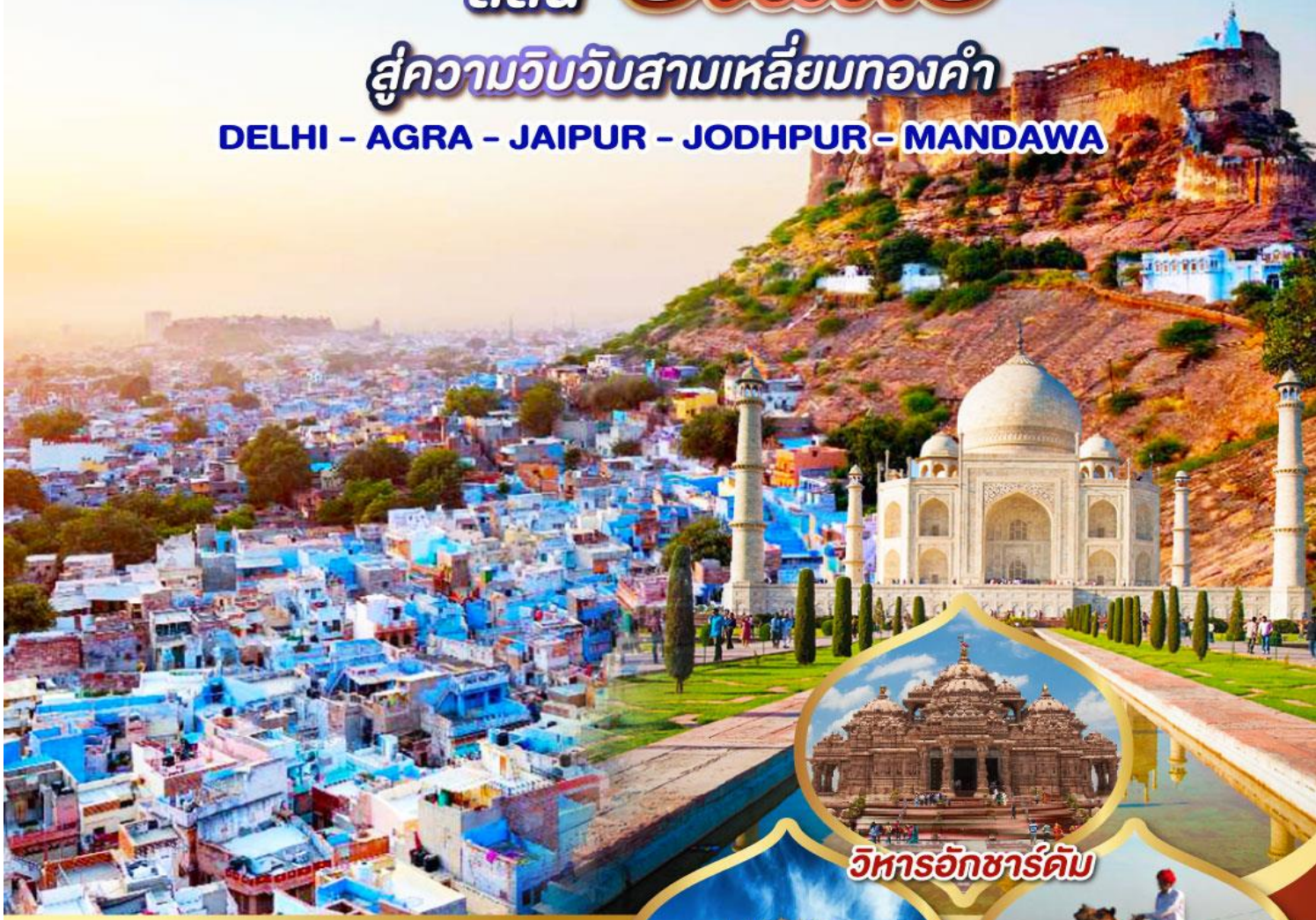
วิหารอักซาร์ตี

DELHI - AGRA - JAIPUR - JODHPUR - MANDAWA