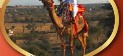
ฟรี ทัชมาฮาล เมืองมันทาวา ราคาเริ่มต้น