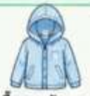
เสื้อคลุมกันแดด/ กันลมบางๆ