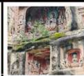
หินแกะสลักหนานคาน