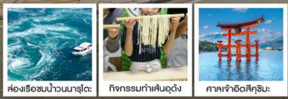
คลองเรือขมน้ำวนมารุโตะ กิจกรรมทำเส้นอุด้ง ศาลเจ้าอิตสึคุชิมะ

วัดบึงขออน / ตลาดกิงงะ / โบสถ์โทกาวาน (จุดชมวิว) / สะพานคินไตเคียว เกาะมียาจิมา ศาลเจ้าอิตสึคุชิมะ / สวนอนุสรณ์สันติภาพฮิโรชิมา โดโกะออนเซ็น / ถนนโอโมเตะซันโด คมปีระซัง / ปราสาทนัตสึยามา กิจกรรมทำเส้นอุด้ง / สวนริทสึริน / สถานีรับทางคุรุคุรุมารุโตะ คลองเรือขมน้ำวนมารุโตะ / ซุปบึงย่านชินโซบาช / ตลาดปลาคุโรมง / ซุปบึงย่านอุมาเดะ