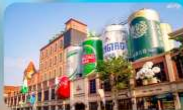
ถนนเบียร์ชิงเต่า