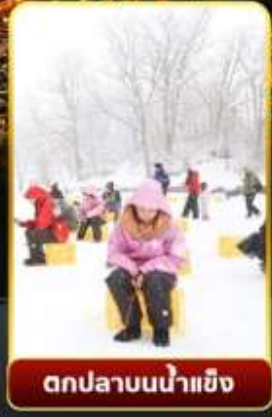
ตกปลาน้ำแข็ง