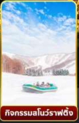
กิจกรรมโนว์ราฟติง