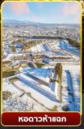
หอดาวห้าแฉก

ออนเซ็น 3 คั้น มน.กระเป๋า 1 ใบ 23 กก 7Days 5Night