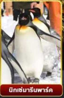
มิทซ์มารีนพาร์ค