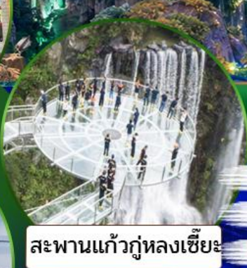
สะพานแก้วคู่หลงเซี่ยะ