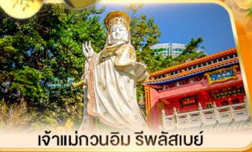
เจ้าแม่กวนอิม ธิพลสเบย์