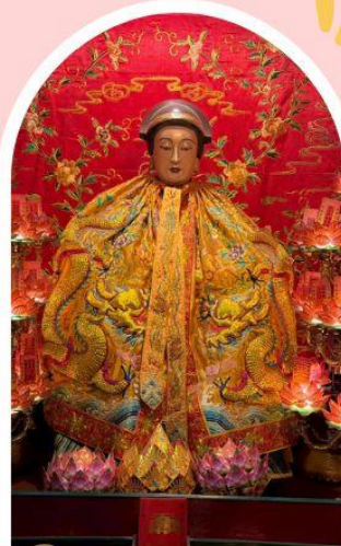
วัดหล่งโหมว

ความสำเร็จ ความมั่งคั่ง เงินทองไหลมาเทมา