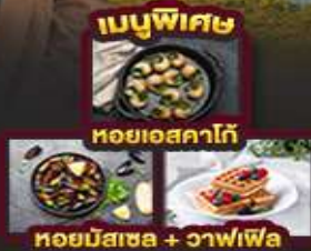
เมนูพิเศษ หอยเอสคาโก้ หอยมีสเซล + วาฟเฟิล