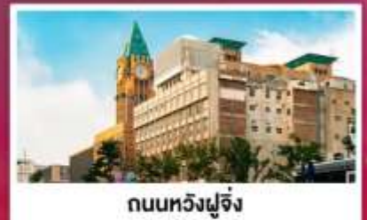
ถนนหวังฝูจิ่ง