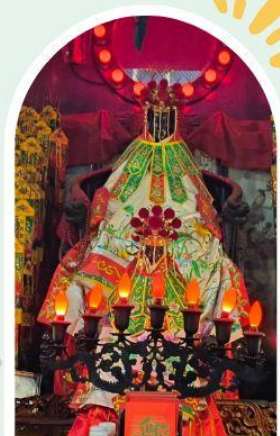
วัดเจ้าแม่กวนอิมองอ่ำ