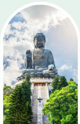
พระใหญ่โป่หลิน