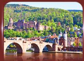
ชมเมืองสวย ไฮเดลเบิร์ก