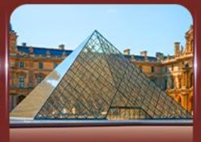
เข็มนาฬิกาพิพิธภัณฑ์ลูฟวร์ ปารีส