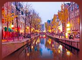
ย่าน Red Light อัมสเตอร์ดัม