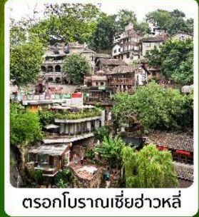
ตรอกโบราณเขี่ยฮ่าวหลี่