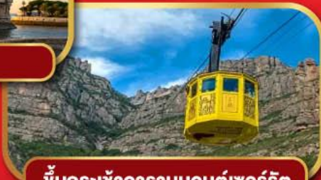
ขึ้นกระเช้าอารามมอนต์เซอรัลด์