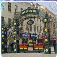
ถนนจงยาง