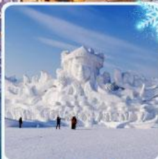
งานแกะสลัก เกาะพระอาทิตย์