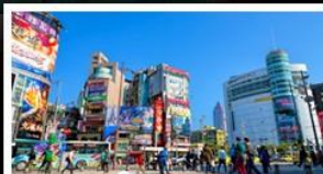
ซ้อปิ้งซีเหมินตง