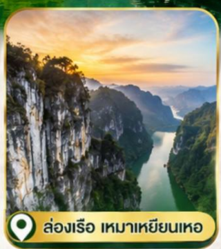
ล่องเรือ เขายายจ้อ