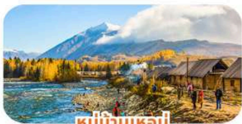
หมู่บ้านเหมอู๋