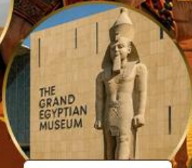
พีพีรภัณฑ์แกรนด์อียิปต์