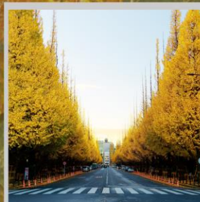
"ICHONAMIKI GINGO AVENUE"