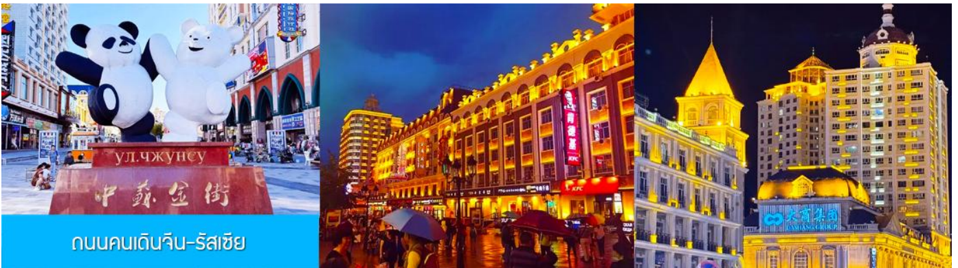
ถนนคนเดินจีน-รัสเซีย

ท่านสามารถเดินเที่ยวชม บริเวณจัตุรัสฯ เก็บภาพสวยงามของสถาปัตยกรรมสวยเก๋แบบรัสเซีย เที่ยวชมบริเวณล็อบบี้ของโรงแรมตุ๊กตารัสเซีย ที่มีการตกแต่งภายในอย่างวิจิตร งดงามทั้งลวดลายการตกแต่งและภาพสีน้ำมัน