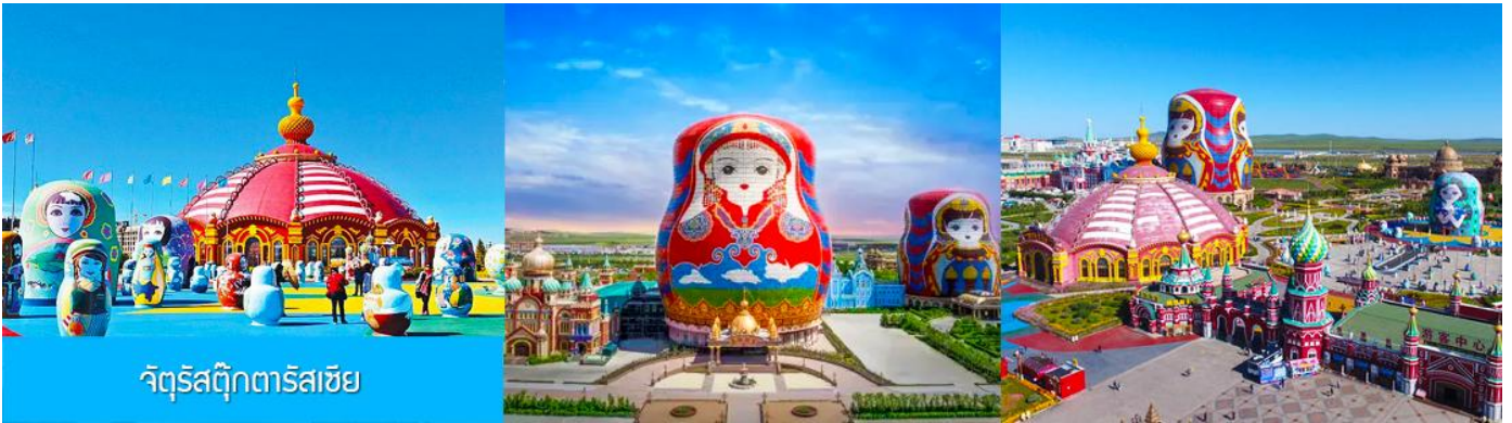
จัตุรัสตุ๊กตารัสเซีย