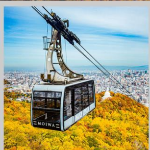
“MT. MOIWA ROPEWAY”