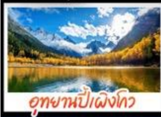
อุทยานป่าแดงโกว