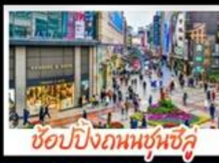
ซ้อมบั้งกนบซุนชิว