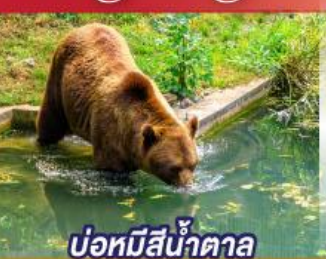
บ่อหมีสีน้ำตาล