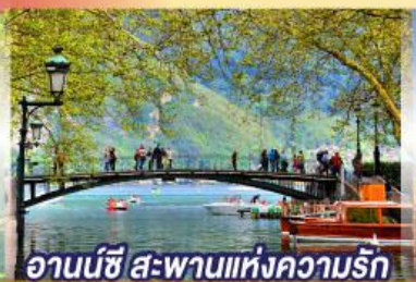
อานน์ซี สะพานแห่งความรัก