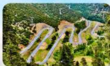
ถนน 18 โค้ง