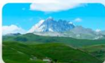
ทุ่งหญ้าด่าง