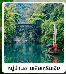
หมู่บ้านซานเสี่ยเหรินเจีย