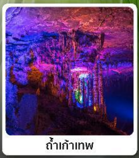
ดำเก้าทพ