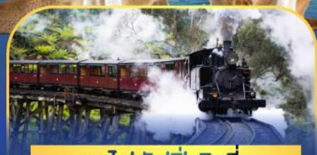
รถไฟพัพฟิงบิลลี่

ล่องเรือชมอ่าวซิดนีย์พร้อมรับประทานอาหารกลางวัน และ เข้าชมสวนสัตว์การองก้า • ล่องเรือชมอ่าวซิดนีย์ • ชมโรงอุปรากรซิดนีย์ • เดินชมย่านเดอะริอคส์ • ดินเนอร์ Half Lobster • บินเที่ยวบินภายในจากซิดนีย์สู่เมลเบิร์น • ชมขบวนพาเหรดนกเพนกวิน • นั่งรถไฟหัวรถจักรไอ้ปuffing Billy • ช้อปปิ้งจุใจในนครเมลเบิร์น