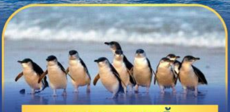
พาเหรดนกเพนกวิน