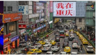
กวนอิมเจียว

*ทางบริษัทฯ ขอสงวนสิทธิ์ในการสลับโปรแกรมทัวร์ตามความเหมาะสมขึ้นอยู่กับสถานการณ์หน้างาน โดยคำนึงถึงผลประโยชน์ของลูกค้าเป็นสำคัญ