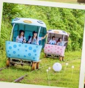
Shen'ao Rail Bike