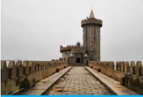
คาเฟ่อัสดง