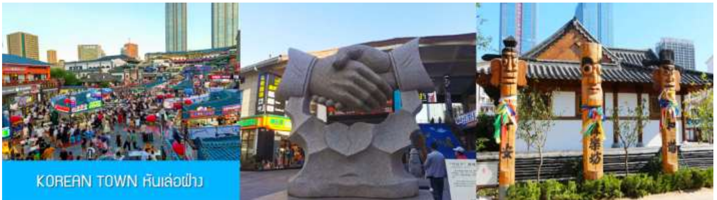
KOREAN TOWN หันเล่อฝาง