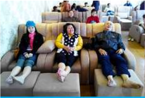
ศูนย์วิจัยแพทยแผนจีน