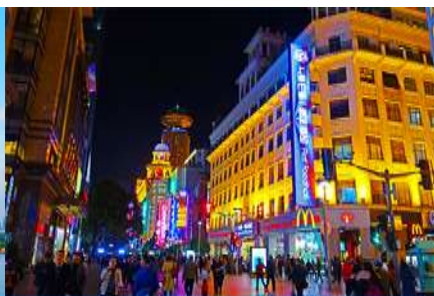
ถนนคนเดินหนานจิงลุ่