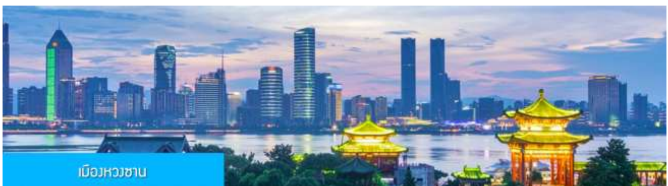
เมืองหวงชาน

ทางบริษัทฯ ขอสงวนสิทธิ์ในการสลับโปรแกรมทัวร์ตามความเหมาะสมขึ้นอยู่กับสถานการณ์หน้างาน โดยยึดถือผลประโยชน์ของลูกค้าเป็นสำคัญ