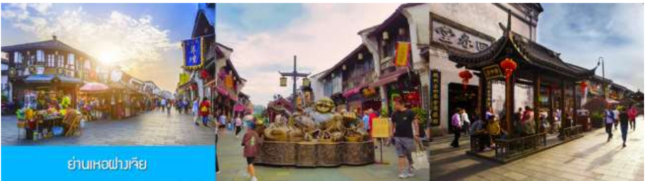
ย่านเหอฝางเจีย