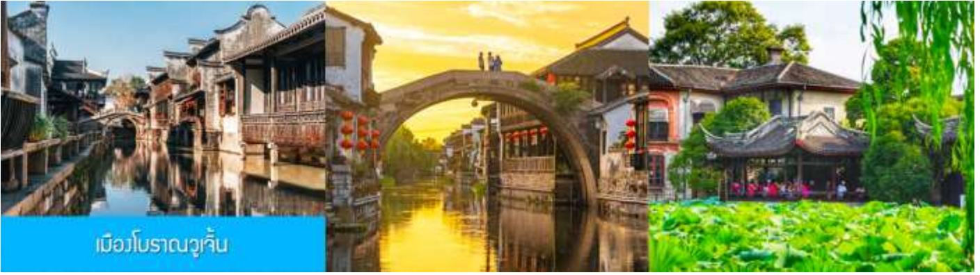
เมืองโบราณวูเจิน