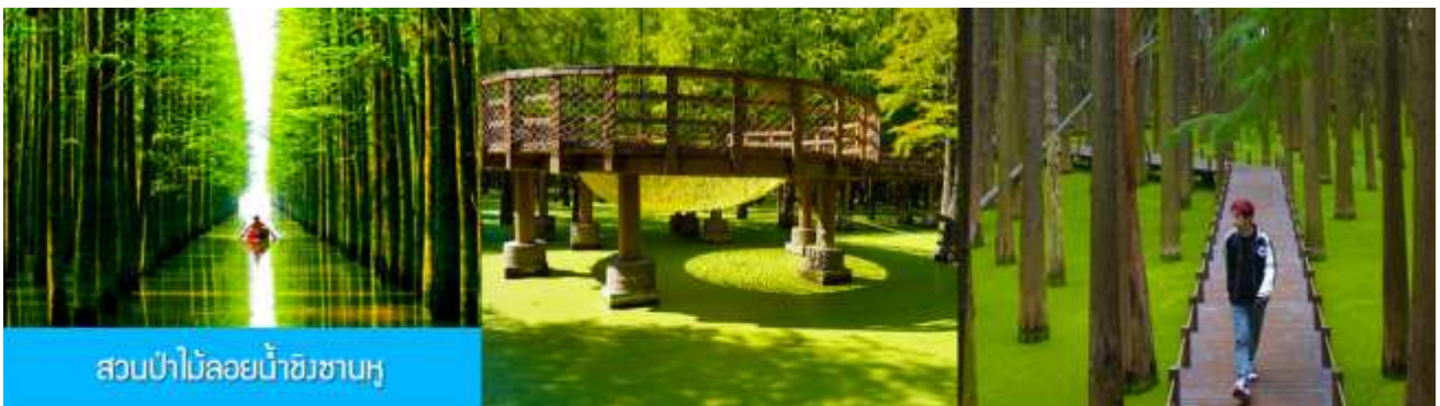
สวนป่าไม้ลอยน้ำชิงชานหู

หลังอาหารเช้าท่านเดินทางโดยรถบัสสู่เมืองหลิงอัน 临安市 (ระยะทาง 175 กม. ใช้เวลาเดินทางราว 2 ชั่วโมงเศษ)