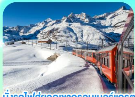
นั่งรถไฟสู่ยอดเขารอนเนอร์เกรต