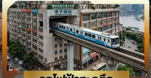
รถไฟฟ้าทะลุติ๊ก