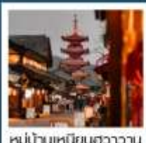
หมู่บ้านเหินยวนฮาวาน