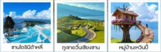
ซานโตรินี่ต้าหลี่ ภูเขาอวิ๋นเซียงซาน หมู่บ้านเหวินปี้

“เกาะเสี้ยวฉู...เกาะลึกลับกลางทะเลสาบ เอ้อไห้”