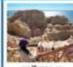
เขตพิศาจทะเล