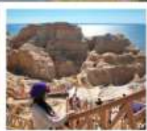
เขตมิงกาทะเล