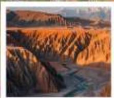
แกรนด์แคนยอนดูซานจือ