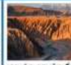
ถ้ำมรกตบนภูเขาไฟ