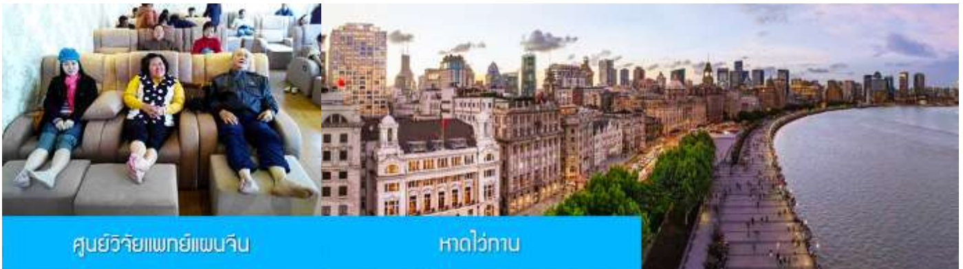
ศูนย์วิจัยแพทยแผนจีน