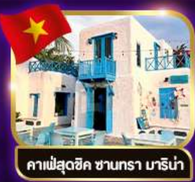
คาเฟ่สุดชิค ซานทรา มาริน่า