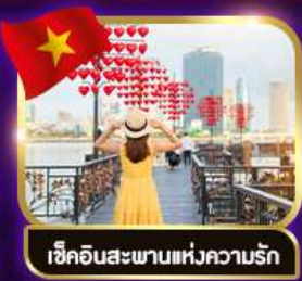
เช็คอินสะพานแห่งความรัก