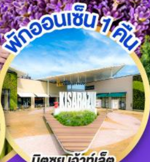
มิตซูเอะอิเกะ พาร์ค คิซะระซุ