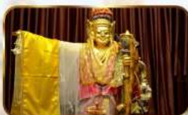
เทพทันใจโจ้เข้า