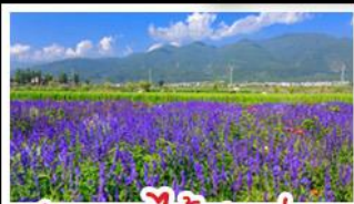
สวนดอกไม้ฮาวอวูมีฉ่าง