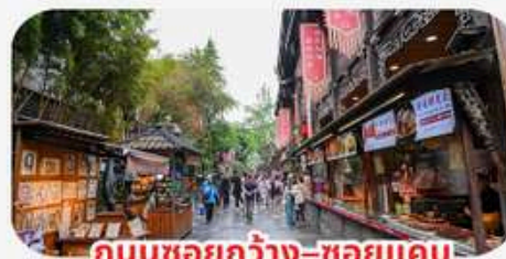
ถนนชอยกว้าง-ชอยแคบ