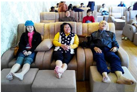
ศูนย์วิจัยแพทย์แผนจีน