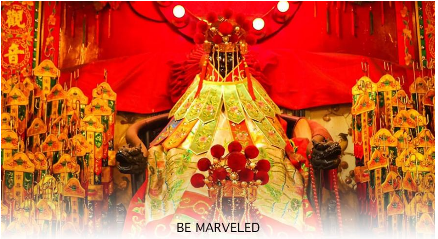
BE MARVELED วัดเจ้าแม่กวนอิมฮองฮา (ยืมเงิน)

ลงบริเวณใกล้กับวัดแห่งนี้หลายต่อหลายครั้ง ทำให้มีผู้บาดเจ็บและล้มตายมากมาย แต่ชาวบ้านที่หนีเข้าไปหลบภัยในวัดนี้ก็กลับปลอดภัยอย่างปาฏิหาริย์ และตัววัดก็ไม่ได้ได้รับความเสียหายจากเหตุการณ์ที่ระเบิดอย่างน่าอัศจรรย์ ตามความเชื่อของคนจีนในฮ่องกง-มาเก๊า จะมี “วันเปิดทรัพย์” หรือ “พิธียืมเงิน เจ้าแม่กวนอิมฮ่องกง” เป็นวันที่จะมาขอพรและยืมเงินเจ้าแม่กวนอิมซึ่งนับจากหลังวันตรุษจีน ไป 26 วัน จะเป็นวันเปิดทรัพย์ที่จัดขึ้นในทุกๆปี พิธีนี้จะมีเพียงครั้งปีละครั้งเท่านั้น เป็นวันสำคัญอีกวันที่คนหลังไหลมาไหว้ขอพรอย่างไม่ขาดสาย