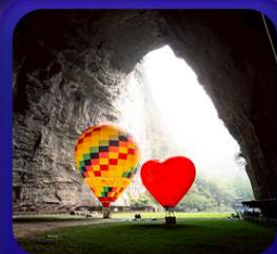
“ ถ้าถึงหลง ”