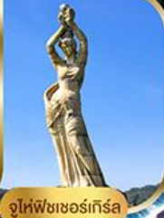
จูไห่ฟิชชอร์ทิวรา